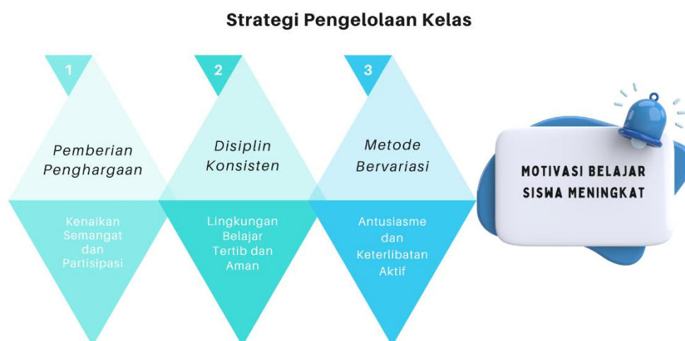
Gambar 2. Skema Korelasi Strategi Pengelolaan Kelas dan Motivasi Belajar Siswa

Gambar tersebut menunjukan bahwa, strategi pengelolaan kelas yang efektif dapat meningkatkan motivasi belajar siswa. Salah satu strategi yang dapat diterapkan adalah pemberian penghargaan. Dengan memberikan apresiasi atas usaha dan pencapaian siswa, semangat serta partisipasi mereka dalam proses belajar akan meningkat. Selain itu, penerapan disiplin yang konsisten juga sangat penting untuk menciptakan lingkungan belajar yang tertib dan aman, sehingga siswa merasa nyaman dan fokus saat belajar. Tak kalah penting, penggunaan metode pembelajaran yang bervariasi mampu menumbuhkan antusiasme serta mendorong keterlibatan aktif siswa dalam setiap kegiatan di kelas. Ketiga strategi ini saling melengkapi dan berkontribusi langsung terhadap meningkatnya motivasi belajar siswa.