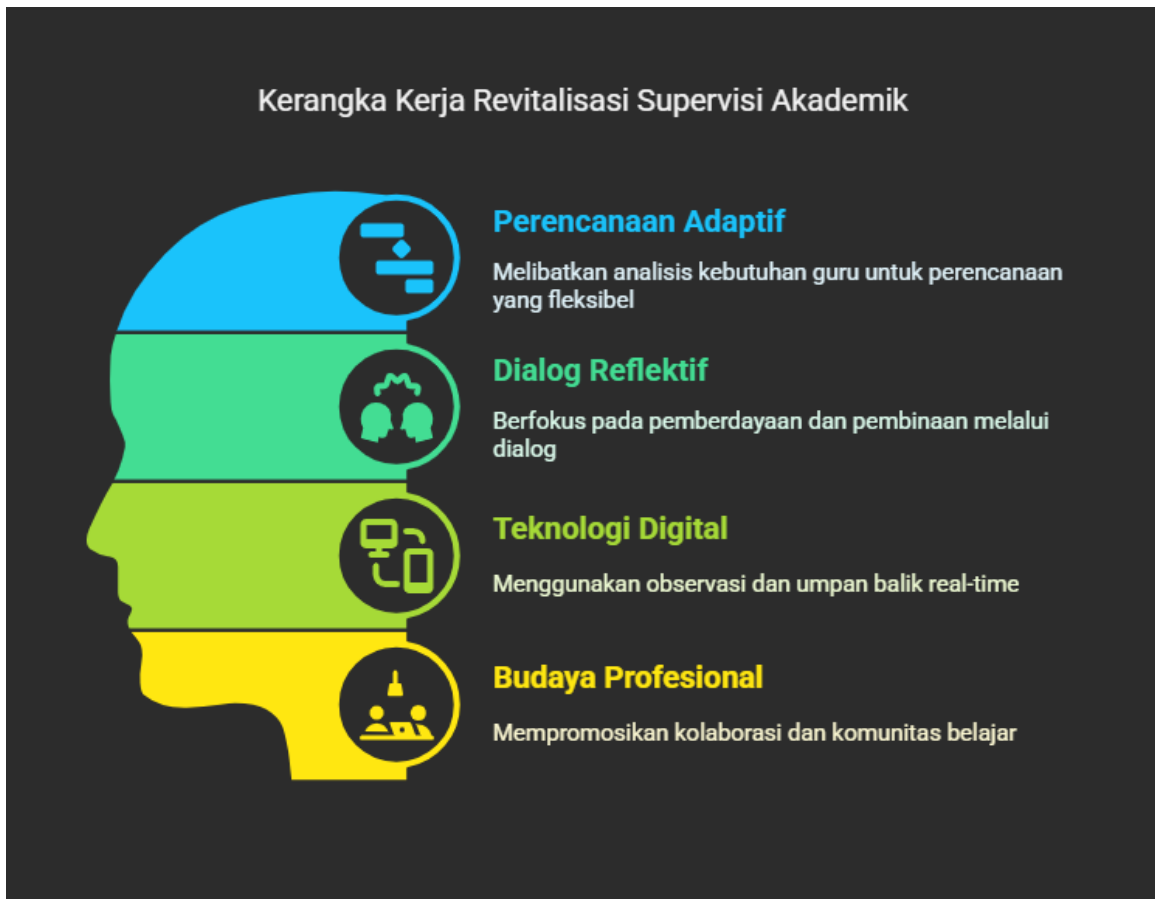
Gambar 3. Struktur Konseptual Revitalisasi Supervisi Akademik

Struktur ini menjadi kerangka kerja teoretis yang dapat dikembangkan lebih lanjut untuk diterapkan di berbagai madrasah dengan kondisi berbeda.